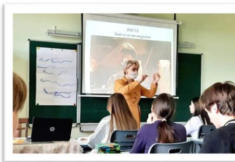
Activități de suport școlar pentru copii din centrele de plasament