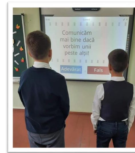
Activități pentru dezvoltarea abilităților de viață și carieră a copiilor din situații vulnerabile