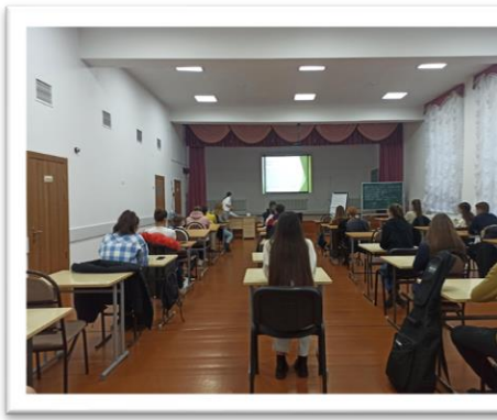
Activități pentru dezvoltarea abilităților de viață și carieră a copiilor din situații vulnerabile