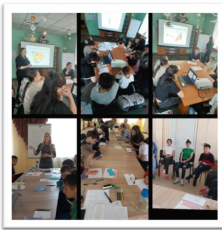
Activități pentru dezvoltarea abilităților de viață și carieră a copiilor din situații vulnerabile