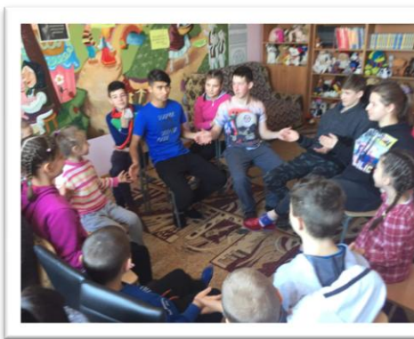
Activități pentru dezvoltarea abilităților de viață și carieră a copiilor din situații vulnerabile