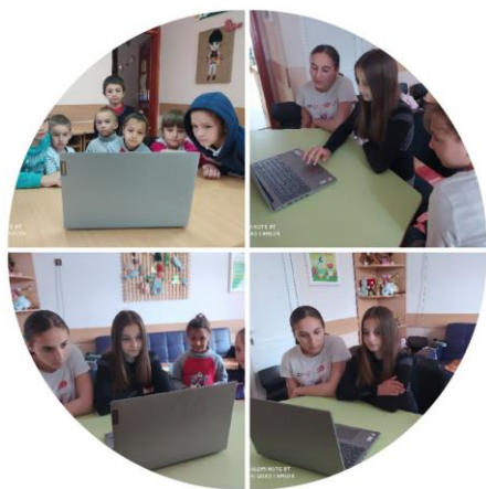
Copilul de astăzi, adultul de mâine

Astfel, asigurându-se accesul copiilor din situații vulnerabile la procesul de învățare la distanță și dezvoltarea abilitățile IT.